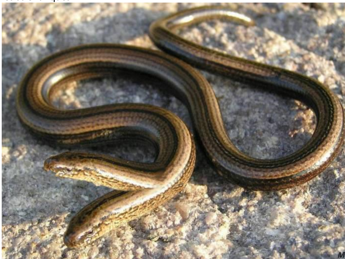
Photo 2: Une nouvelle espèce de serpent a été découverte dans le Doubs, le serpent à deux têtes - C.Régnier - décembre 2024

« Une nouvelle espèce de serpent découverte dans le Doubs. Le serpenticus bicéphalus a été vu dans plusieurs communes. Il est inoffensif. Heureusement ! disent les scientifiques »