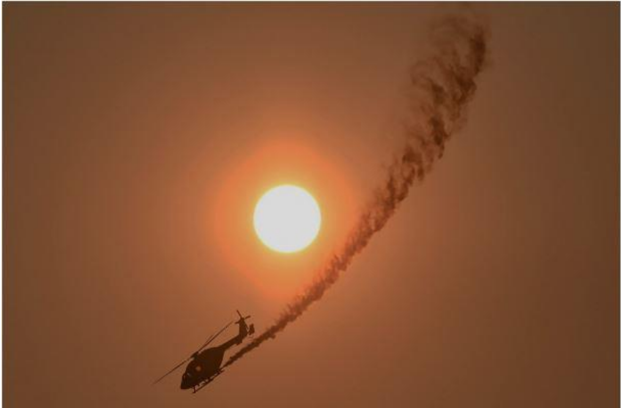
Photo 1: Hélicoptère réalisant une figure aérienne lors de la fête nationale au Sri Lanka. Fév 2016.

Pour le savoir, il aurait fallu écrire sous la photo des informations importantes qui permettent de comprendre l'image. C'est une légende.